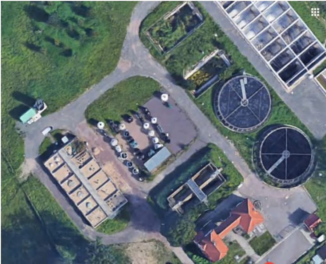
Standort: Kompetenzzentrum in Leipzig/Leutzsch