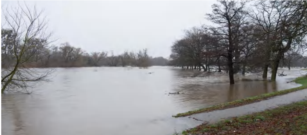
Hochwasser Weihnachten 2023 Stadt Eilenburg, Foto: Carsten Lippert