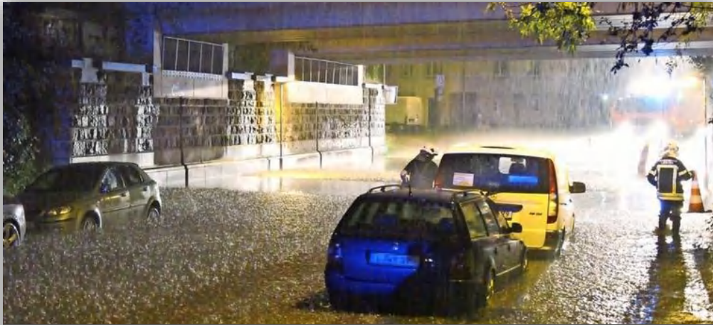
Überschwemmung Leipzig-Sellerhausen, Quelle: Einsatzfahrten Leipzig, Juni 2019