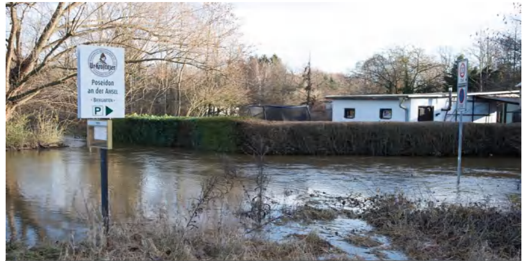
Hochwasser Weihnachten 2023 Stadt Eilenburg, Foto: Carsten Lippert