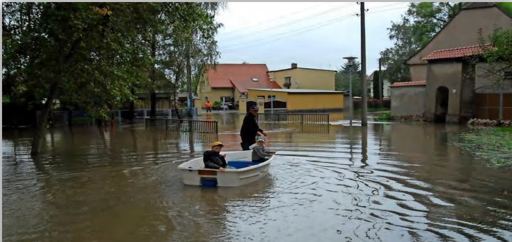
Strengbach-Brücke am Kleinen Dorf in Wiedemar, Foto: Privat, 2009